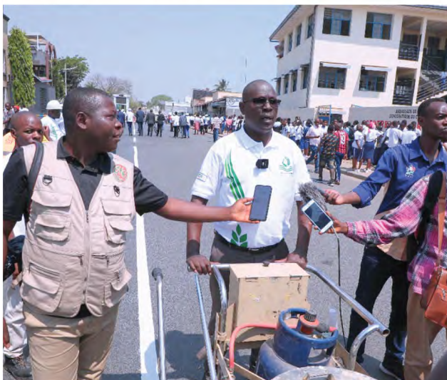
Marquage au sol des passages piétons sur l'Avenue de l'Université

Le Vice-Président de la République du Burundi a ensuite transmis à l'ARCA les félicitations du Gouvernement du Burundi pour le ferme engagement du régulateur dans le suivi du règlement des sinistres par les sociétés d'assurances sachant que, à l'heure actuelle, la plupart des sociétés d'assurances payent les indemnisations rapidement et de façon juste. Il a profité de l'occasion pour encourager toutes les sociétés d'assurances à toujours honorer leurs engagements envers les assurés et bénéficiaires des contrats d'assurances conformément au prescrit du Code des Assurances. Cela va sans doute influencer positivement l'image que la population a des assureurs et instaurer la confiance entre assureurs et assurés.