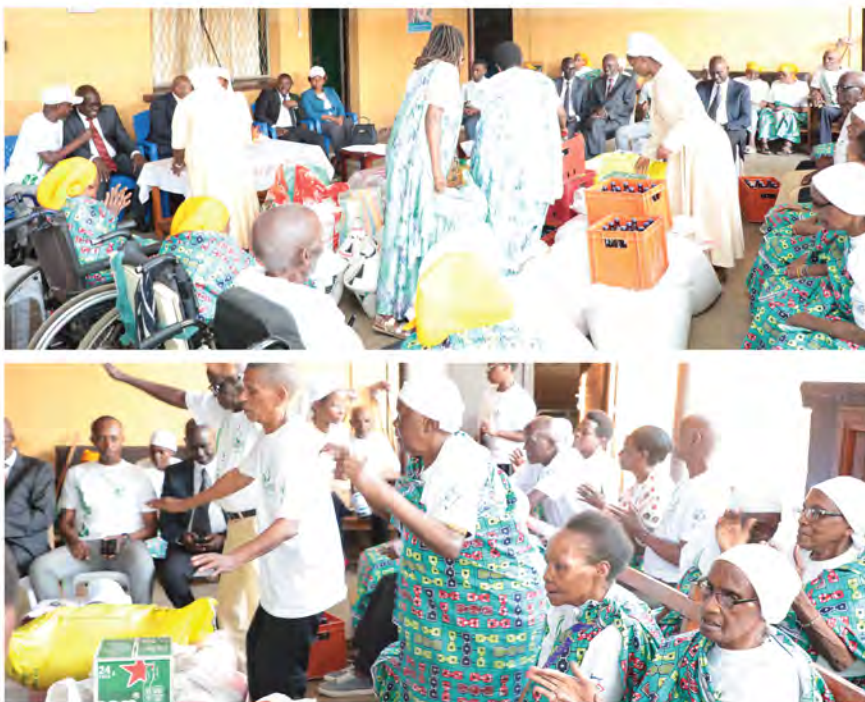
Ambiance à l'hospice Sainte Elisabeth de Rohero

En outre, il a été organisé une action caritative en faveur des cinquante personnes âgées prises en charge par la congrégation des Sœurs BENE MUKAMA à l'hospice Sainte Elisabeth de Rohero. L'activité a été marquée par la remise des dons par le Secrétaire Général de l'ARCA et le Président de l'ASSUR, accompagnés par les Administrateurs Directeurs Généraux et les Directeurs Généraux des Compagnies d'assurances.