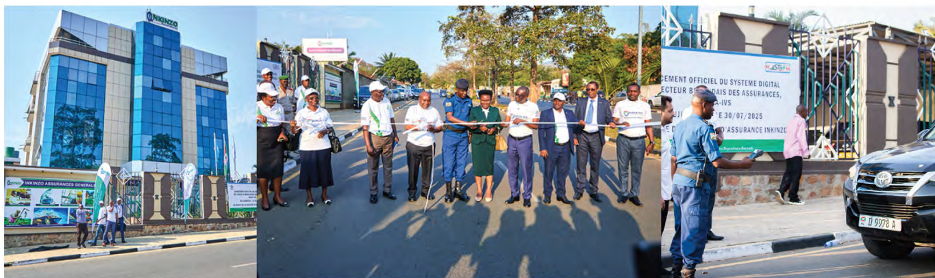
Lancement officiel du système digital de vérification des contrats d'assurance au siège de la société INKINZO AG