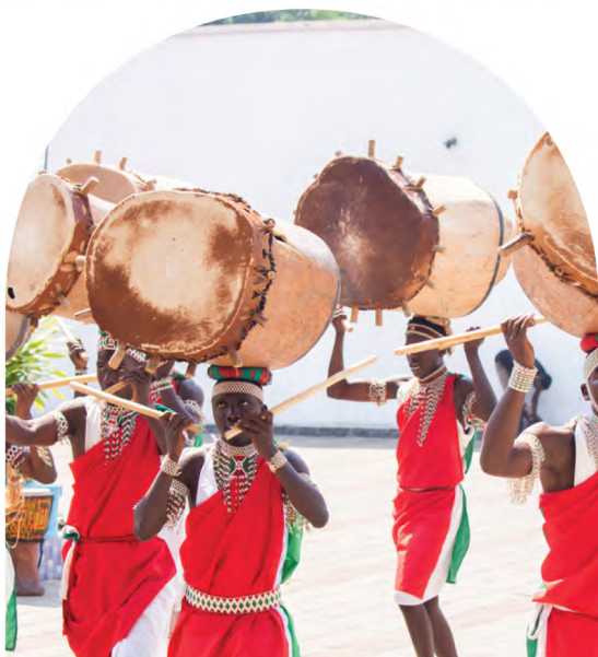
Agrémentation des cérémonies par le tambour burundais (Patrimoine culturelle de l'UNESCO)

Le lancement des activités proprement dites de la quatrième édition de la Semaine dédiée à l'Assurance au Burundi a eu lieu le 30 juillet 2025 au Restaurant la Détente. Il a été marqué par différents discours qui se sont succédé à savoir le Mot d'accueil du représentant du Gouverneur de la Province Bujumbura, l'allocution du Président de l'ASSUR (représentant des acteurs du marché des assurances) ainsi que le discours d'ouverture solennelle de l'événement qui a été prononcé par Son Excellence Monsieur le Vice-Président de la République du Burundi.