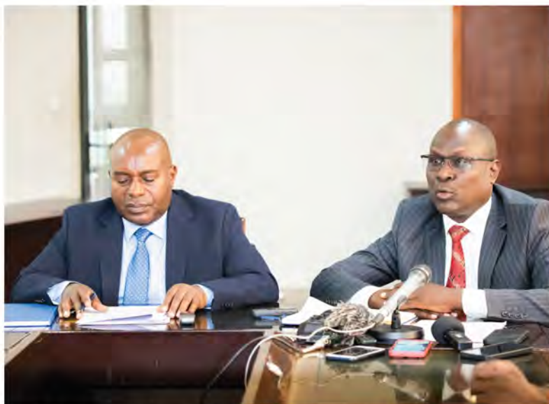
De gauche à droite : SG de l'ARCA et Prés. de l'ASSUR

Les activités de la quatrième édition de la semaine dédiée à l'assurance au Burundi ont démarré par une conférence de presse animée conjointement par le Secrétaire Général de l'ARCA et le Président de l'ASSUR suivie par des émissions radiodiffusées et des spots publicitaires, le Roadshow et des manifestations folkloriques pour annoncer l'événement.