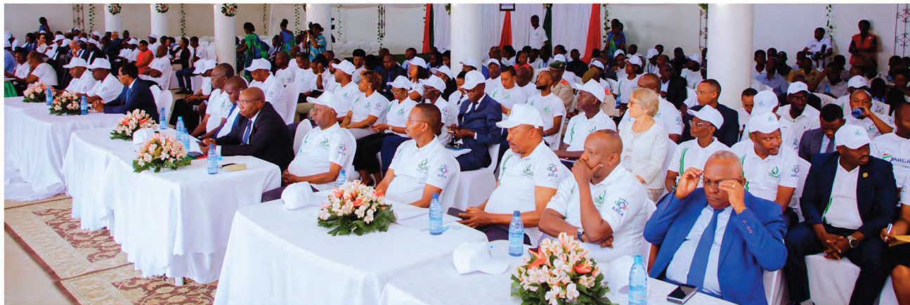
Les participants lors du lancement officiel de la semaine dédiée à l'assurance

Il a enfin terminé son propos en exprimant le vœu que la quatrième édition de la Semaine dédiée à l'assurance au Burundi soit une opportunité de sensibilisation et d'éducation de la population à la culture du risque en général et du risque agricole en particulier.