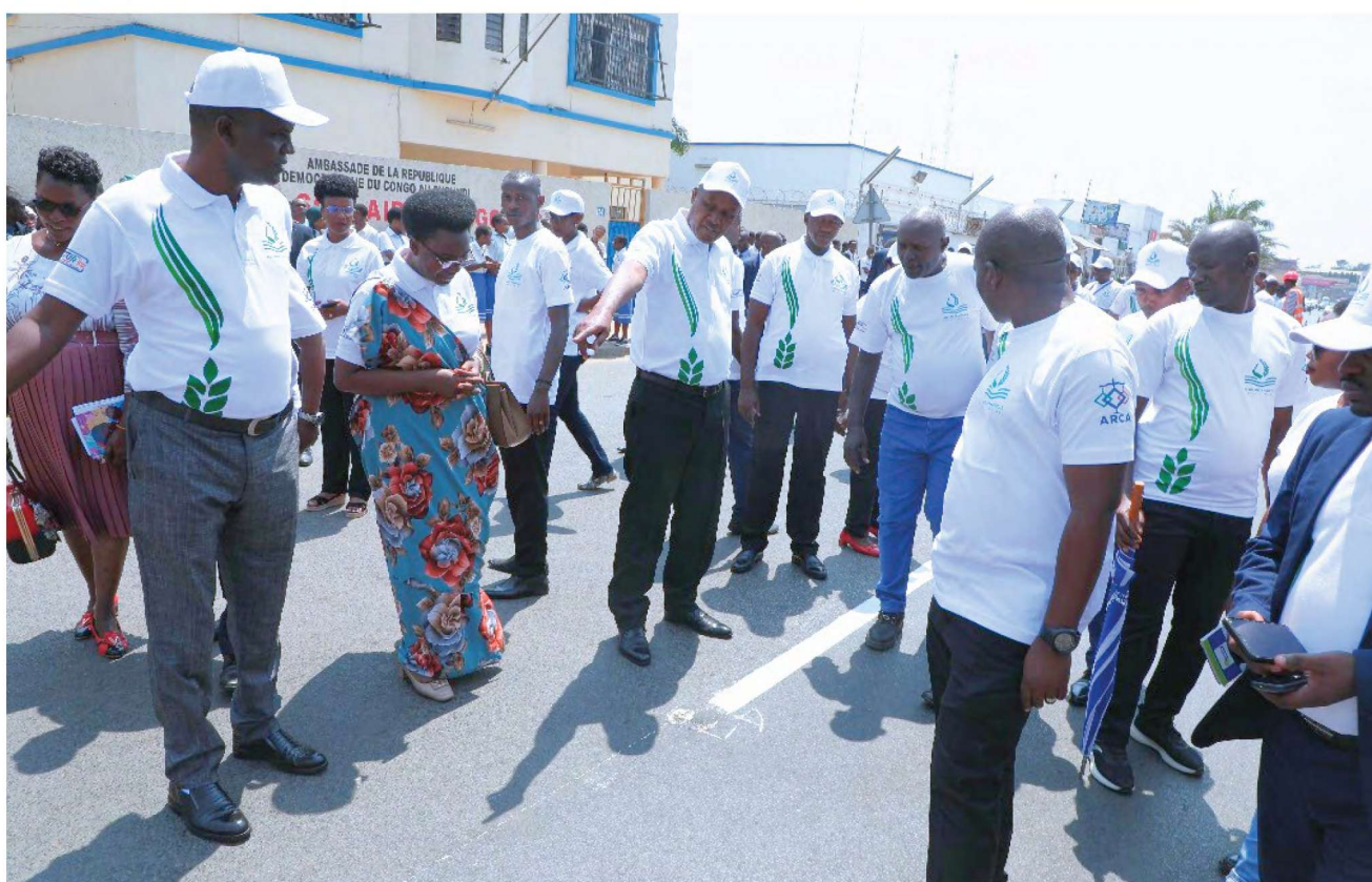
Lancement de marquage au sol des passages piétons sur la Chaussée Prince Louis RWAGASORE et l'Avenue de la RDC par Son Excellence Monsieur le Vice-Président de la République du Burundi