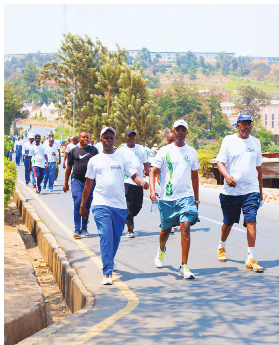
Marche/Jogging à Kiriri

Cette activité sportive était animée par des chants et avait été organisée dans la même optique de sensibiliser la population à l'assurance parce qu'il contribue au bien-être du corps humain et améliore la santé. Si l'assurance protège et répare, vaut mieux prévenir par l'entretien du capital humain qui produit des biens assurables.