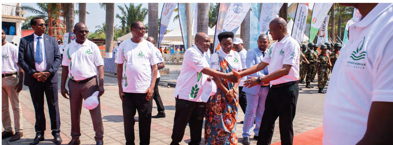
Accueil de Son Excellence Monsieur le Vice-Président de la République du Burundi

Le lancement des activités proprement dites de la quatrième édition de la Semaine dédiée à l'Assurance au Burundi a eu lieu le 30 juillet 2025 au Restaurant la Détente. Il a été marqué par différents discours qui se sont succédé à savoir le Mot d'accueil du représentant du Gouverneur de la Province Bujumbura, l'allocution du Président de l'ASSUR (représentant des acteurs du marché des assurances) ainsi que le discours d'ouverture solennelle de l'événement qui a été prononcé par Son Excellence Monsieur le Vice-Président de la République du Burundi.