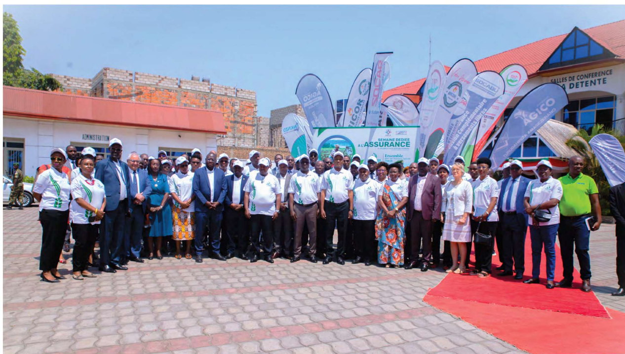
Photo de famille après l'ouverture solennelle des activités de la semaine dédiée à l'assurance