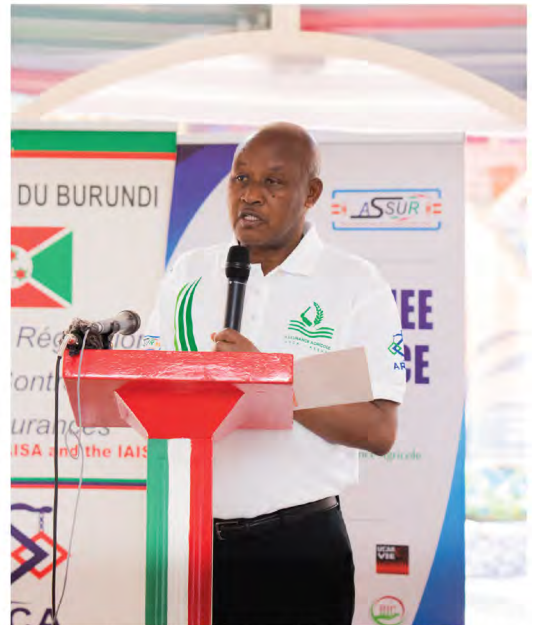
Son Excellence Monsieur le Vice-Président de la République du Burundi

Il s'est réjoui de l'objectif principal de l'activité à savoir la sensibilisation et l'éducation de la population à l'assurance en vue de l'inciter à la protection des personnes et du patrimoine pour prévenir et réduire les risques et ainsi contribuer à l'amélioration des conditions de vie des citoyens.