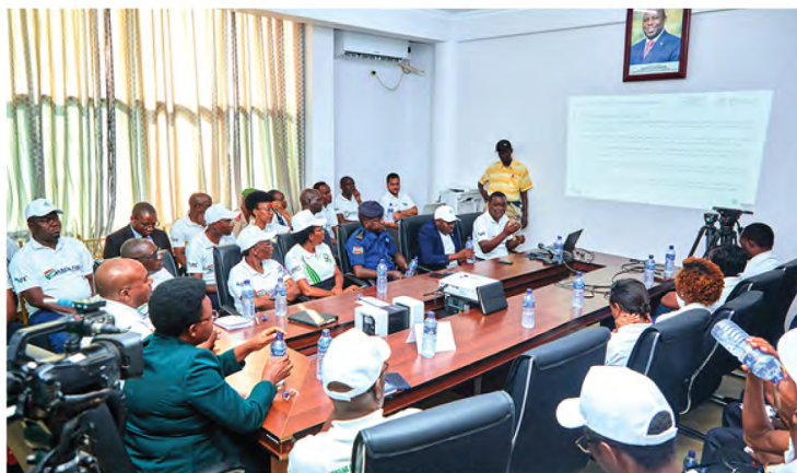
Séance de démonstration du fonctionnement du système ARCA IVS dans la salle de la société INKINZO AG

La 3 ème édition de la semaine dédiée à l'assurance célébrée en 2024 avait comme thème central : « L'innovation au service du développement du secteur des assurances ». Depuis lors, l'ARCA a entamé un vaste chantier de digitalisation du secteur des assurances afin de renforcer le contrôle et améliorer les services du secteur des assurances.